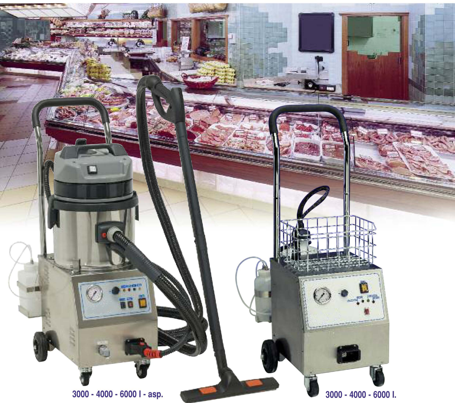
3000 - 4000 - 6000 l - asp.

Ideali per una pulizia veloce e di fondo in tutti gli ambienti, come gelateria, macellerie, pasticcerie, salumerie, ristoranti, cliniche ed ospedali oltre che lavaggi di interni di auto, bus e carrozze ferroviarie e nelle aziende meccaniche